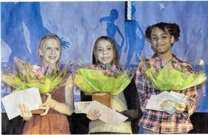
Les vainqueurs de la catégorie juniors.