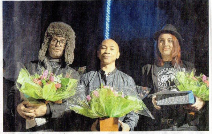
Les vainqueurs de la catégorie masters.

WITERSDORF Concours de chant de l'association Music Art System