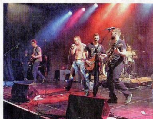
Black Velvet est venu de Belfort défendre ses chances.

Lost et les Coqs à Poil se sont illustrés de manière convaincante. Le public a en effet désigné son choucou de la soirée en consacrant Lost, une formation de jeunes musiciens hunois par ailleurs anciens compagnons de route de Flo Bauer, le rockeur mûre et génial bien connu maintenant. Lost, prenant le contre-pied des décibels balancés en début de soirée, a fait mouche avec un rock travaillé et en anglais, très