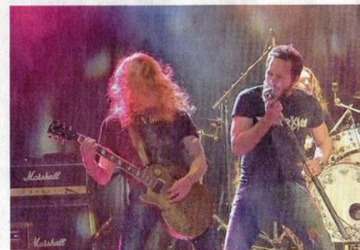
Thunderkiss 44.

mélodique, à la limite de la douceur et de l'émotion au milieu de riffs plus denses. Le quatuor, qui a sorti son EP Change la semaine dernière, aura l'honneur de fouler la grande scène lors du prochain Festival de l'Amitié (les 8 et 9 juin). Une chance qu'a su saisir également le groupe des Coqs à Poil, qui s'est vu décerner le coup de cœur de l'ensemble du comité Music'Art System (et de la presse !), celui-ci n'ayant pas pris part au vote du public. Le quatuor, qui dégage une énergie folle sur scène, accueille en son sein «Emma Poule», une bassiste qui met son petit grain dans cette basse-cour survoltée. Sur des textes énervés et plein d'humour en français, c'est un bon vieux rock'n roll, sans oublier une paille de blues, qui a achevé la soirée. ■