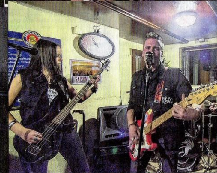
Quatre groupes seront en compétition le samedi 10 mars (de g. à d. et de haut en bas) : Moral Skid, Thunderkiss 44, Lost et les (joliment nommés) Coqs à poil.