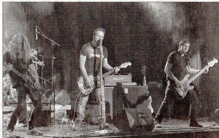
Le groupe Thunderkiss 44 a ouvert la soirée.