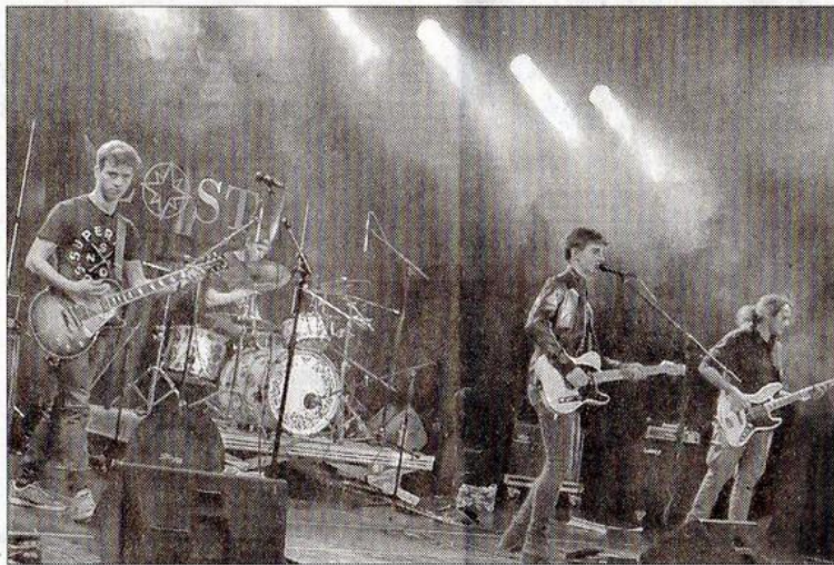
Les jeunes rockers du groupe Lost ont remporté le tremplin. Déjà une belle reconnaissance.

Samedi soir, la Halle au blé a accueilli quelque 150 personnes, qui allaient et venaient au gré du moment, et quatre formations de rockers talentueux. Le groupe Thunderkiss 44 a ouvert le bal avec un heavy metal bien lourd qui a planté le décor. À sa suite, les Belfortains de Black Velvet ont assumé un hard rock bien métallique. Les deux premiers groupes n'ont pas