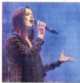
Technique vocale, présence scénique ou qualité de l'interprétation : tout était scruté par le jury.