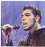
Une quarantaine de chanteurs amateurs avaient répondu à l'appel de Music Art System.