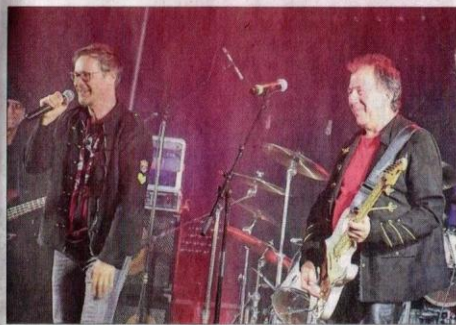
Le groupe Very Moore, cover band allemand de Gary Moore, a été la tête d'affiche du vendredi soir.

Le set de quarante-cinq minutes, avec un répertoire étof-